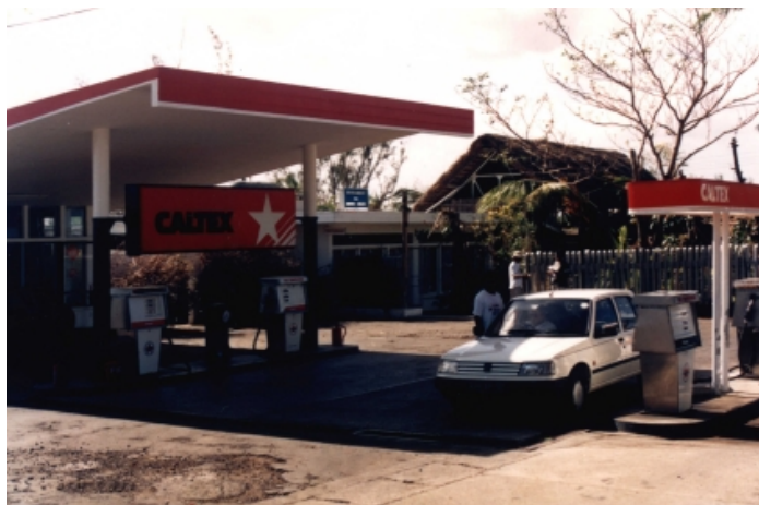
Benzinová pumpa, kde Ian úpěnlivě prosil o svůj život

Tak jsem se snažil znovu se postavit. Belhal jsem se pomalu po silnici, až jsem narazil na několik aut vedle restaurace. Šel jsem k těmto autům a prosil jsem řidiče, aby mě vzali do nemocnice. Muž v autě se na mě podíval a řekl mi: „Kolik nám zaplatíš?“ Kdybyste žili v Asii, pochopili byste, že to je normální. Máte peníze, tak jedete; nemáte peníze, nejedete nikam. Tak jsem řekl nahlas spíše pro sebe: „Nemám žádné peníze.“ Pak jsem si však uvědomil, jak hloupě jsem se zachoval. To jsem neměl říkat. Měl jsem zalhat, ale místo toho jsem řekl pravdu, že nemám peníze. Ti tři řidiči se jen zasmáli: „Jsi opilý, zbláznil ses.“ Otočili se, zapálili si cigaretu a odcházeli ode mne pryč.