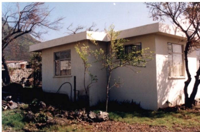
Zadní část přízemního domku, kde Ian spal

Nakonec nadešla moje poslední noc a byl jsem sbalený a připravený odejít. Taxík měl pro mě přijet v 5 hodin ráno. Sel jsem spát, ale v noci jsem se probudil, tentokrát kamením, které někdo házel do okna. Byla to znovu ta dívka. Byl jsem připravený a měl jsem zamknuté dveře, ale nechal jsem otevřené malé okénko. Přemýšlel jsem: „Ať už jsou tyhle stvůry cokoliv, chtějí mě zabít a k tomuto účelu si používají lidské bytosti!“ Chtěl jsem vyskočit a zavřít to okno, když vtom skrze ně prošla veliká černá ruka a trhla za kliku. Slyšel jsem tuhle dívku, jak říká něžným hláskem: „Iane, chceme si s tebou promluvit. Pojď ven!“ Předstíral jsem, že spím a znovu začaly dopadat kameny na okno. Tentokrát byla hlasitější: „Iane, pojď ven!“ Pak skrze okno začaly dopadat ještě větší kameny a tentokrát už byla našťvaná: „Iane, vylez ven!“ Najednou jsem se otočil a vtom jsem uviděl, jak skrze otevřené okno na mě letí oštěp. Vzal jsem baterku. „Nejlepší obrana je útok,“ pomyslel jsem si a posvítíl jsem baterkou přímo do očí toho oštěpaře. Znovu v nich byla ta červená záře! Zakřičel jsem z plných plic, chytil jsem jeho oštěp a vyhodil jsem ho z okna a okno jsem zabouchl a zavřel. Rychle jsem posvítíl baterkou ven na tři muže a jednu ženu. Krčili se jako psi, kteří mají být ukamenováni. Co mě udivilo, bylo to, jak se báli světla.