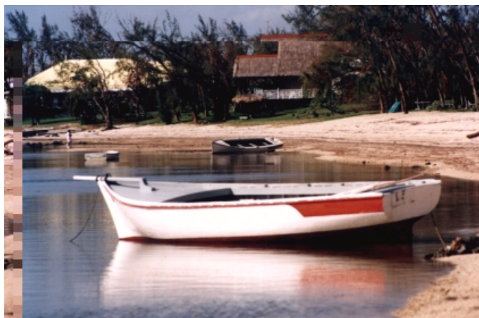
Riviere Noire, místo kde loďka připlula a lan byl ponechán o samotě