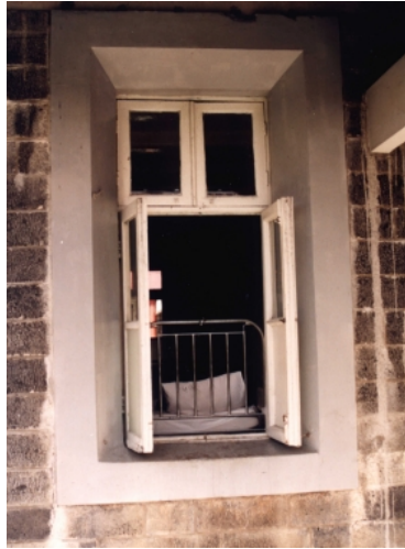
Okno nemocničního pokoje

Byl jsem vyčerpaný a hladový. Probudil jsem se znovu uprostřed noci a celý jsem se chvěl a byl jsem zpocený. Moje srdce bylo plné hrůzy. Ležel jsem tváří obrácený ke stěně. Otočil jsem se, abych se podíval, cože mě to tak děsí. Skrze moji síť proti komárům a skrze železné mříže na okně jsem uviděl oči, možná sedm nebo osm párů očí, které na mě hleděly. Vyzařovaly červená světýlka. Namísto kulatých zornic měly úzké, jako mají kočky. Zdálo se, že jsou napůl lidské a napůl zvířecí. Myslel jsem si: „Co tohle, proboha, jen může být?“ Dívaly se do mých očí a já jsem hleděl do těch jejich, když vtom jsem uslyšel: „Jsi náš, my se vracíme.“ „Ne nevracíte!“ řekl jsem. Chytil jsem svoji baterku a posvítil jsem na ně. Nic tam nebylo. Ale já vím, že jsem je právě viděl!