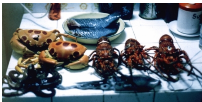
Typická sklizeň z moře

Na tomto ostrově jsem žil v „Tamarin Bay“ (bay = zátoka) mezi místními lovci krabů a surfaři. Přijali mě do svých životů a naučili mě potápět se v noci podél útesů. Noční potápění je úžasná zkušenost. Krabi vylézají v noci a můžete je svojí podvodní baterkou oslepit a velmi jednoduše si je vzít. Ryby v noci spí a tak si můžete vybrat, kterou si dáte k večeři.