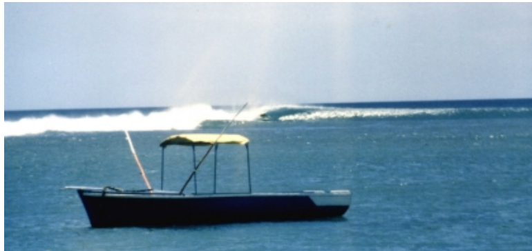
Surfování - Mauritius

Na ostrově Réunion jsem narazil na úžasný surfařský příboj zvaný Sv. Leu, kde byly obrovské vlny. Byl březen 1982 a cestoval jsem již téměř dva roky, často jsem spal ve stanu na plážích a žil jsem jako tulák.