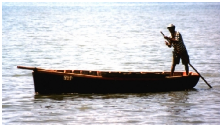
Dřevěná loďka – Mauritius

Mohl jsem mezitím cítit, jak se mi jed dostává do krevního oběhu a v podpaží na něco naráží. Narážel na lymfatickou žlázu. Bylo pro mě stále těžší, abych se nadechl do své pravé plíce. Moje pravá plíce byla omezená potápěčským oblekem, tak jsem ho uvolnil levou rukou, svlékl ho a navlékl si kalhoty, dokud jsem se ještě mohl hýbat. Ústa jsem měl suchá, seděl jsem tam a pot ze mě jen kapal. Cítil jsem, jak se ten jed ve mě pohybuje. Cítil jsem ostrou bolest v zádech, jako kdyby mě něco udeřilo do ledvin. Snažil jsem se nehýbat a zachovat klid. Byli jsme jen asi na půl cesty od pobřeží, a já jsem doslova cítil, jak ve mně ten jed pulzuje a pohybuje se v krevním oběhu.