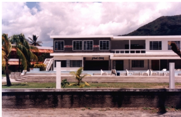
Hotel Tamarin Bay